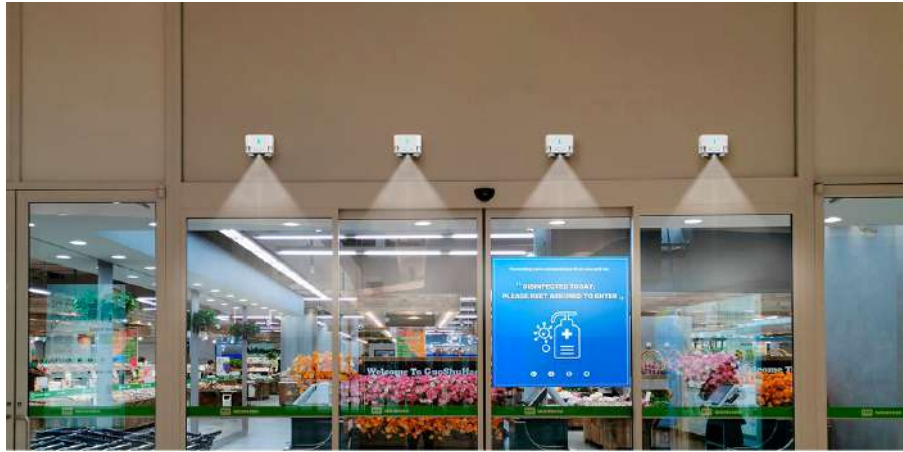
Áreas públicas - Supermercados