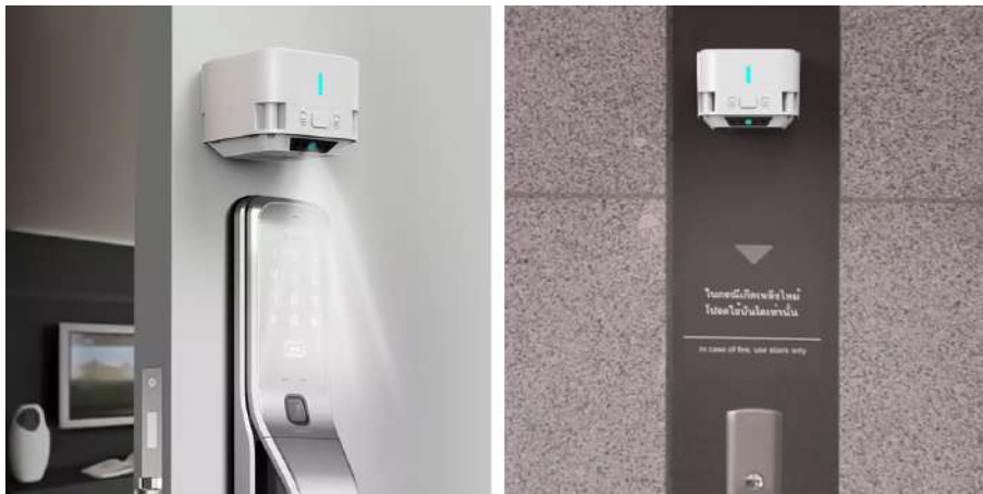
Manijas de puertas y botones de ascensor